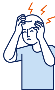
Maux de tête